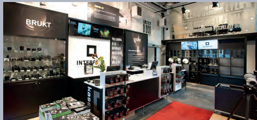
Fra avdeling Interfoto på Skøyen